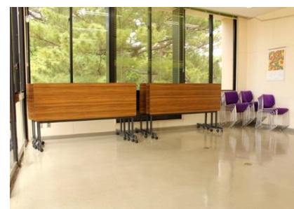
【第3会議室】 【第4会議室】 各20人 テーブル 7台 イス 21脚