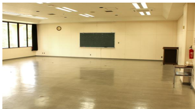
【中研修室】80人 テーブル27台・イス80脚