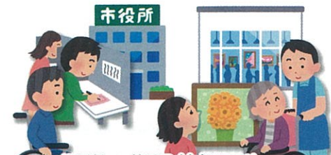
選挙の期日前投票や、芸術活動、美術館等への送迎