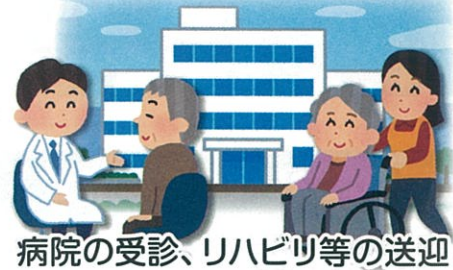
病院の受診、リハビリ等の送迎