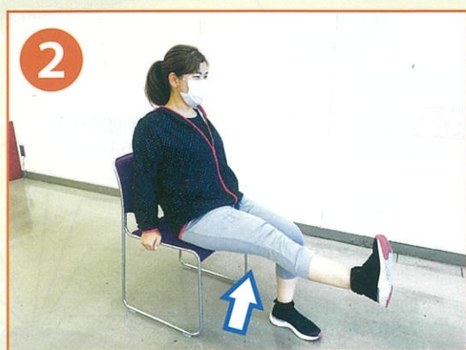
ふとももをイスにつけたままひざを伸ばします。