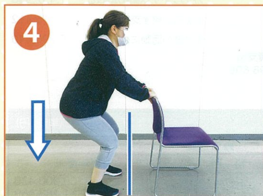
肩幅程度に足を広げ、イスや机を支えにして、座るように腰をおろします。 ひざがつま先より前に出ないように 行いましょう。