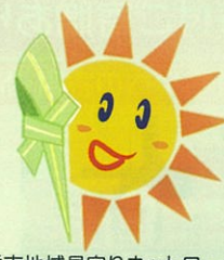
浦添市地域見守りネットワーク事業 イメージキャラクター てだこサンSUN君

→カウンセリングと言うとハードルが高いイメージがありますが、「誰に相談していいかわからない、でも誰かに話を聞いてもらいたい」、そういう時に相談できる「心のよりどころ」としてぜひ気軽に活用してください。