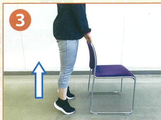
イスや壁を支えにして、ゆっくりかかとをあげます。

※家事のちょっとした合間にオススメです。痛みのない範囲で行ってみましょう。水分補給も忘れずに!