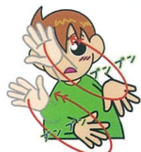
手のひらを前に向け、斜め下に勢いよく下ろします。

今回紹介する手話は「台風」です。9月といえばまだまだ台風シーズンですね。停電等に備えて情報の入手先の確保、懐中電灯や水等の準備など普段からの備えが大切です。また、隣近所での支え合いも災害時には大切です。日頃からの挨拶を通して気に掛け合うことから始めてみましょう。