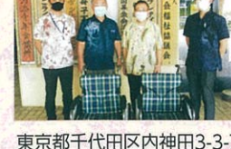
東京都千代田区内神田3-3-7 ピップ株式会社 様より 車椅子2台