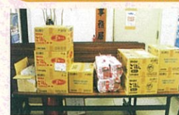
今津 新之助・由美子 様より 食料品・日用品