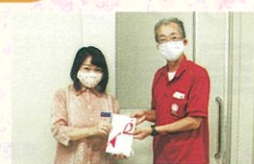
浦添市安波茶1-13-9 浦添ニュータウン自治会 様より 16,000円 ※マスク売上収益金一部として