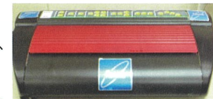
点字用プリンター