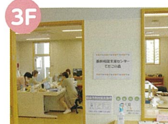
障がい者(児)基幹相談支援センター 「てだこの森」 tel (098)942-7601