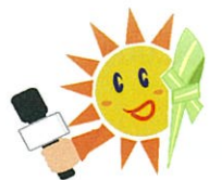
浦添地域見守りネットワーク事業イメージキャラクター てくださいサンSUN君

地域の皆さんのボランティアに関するステキなエピソードを教えてください。そして、気軽に「ボラセン」に来てください!