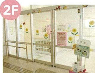
児童発達支援センター 「たんぼぼ」 tel (098)875-1502