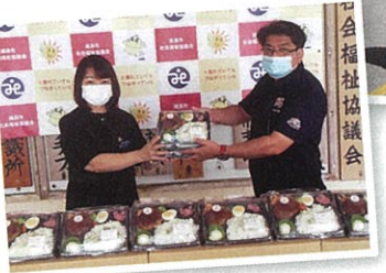
▲お弁当(でいご君弁当)の贈呈式

浦添市社会福祉協議会では市内のモデル地区小学校の児童を対象に、夏休み期間の毎週水曜日に、沖食グループさんが作るお弁当(でいご君弁当)を地域の相談役である民生委員児童委員が、自宅までお届けする企画を実施しました。地域全体で子どもの成長を支えるという主体的な意識の向上を目指して、沖食グループ、学校、民生委員児童委員、自治会など多くの方々のご協力をいただき、「食」と