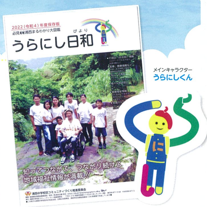
メインキャラクター うらにしくん

皆さんこんにちは!今回は浦西中学校区の取り組みを紹介します。 困ったときの相談先がわからない、地域の人たちと関わる機会が少ないという声がかきかけとなり、浦西中学校区内の自治会、地域活動、相談・医療・教育機関、企業などの情報を集約した地域福祉情報誌の発刊について、浦西中学校区コミュニティづくり推進委員会にて協議され、編集部が立ち上がり、制作に取り組んできました。自治会、企業の皆様より協賛をいただき、令和5年1月に『うらにし日和』を刊行し、浦西中学校区内の全世帯、企業や店舗へ配布しました。地域資源を可視化することにより、相談窓口の周知、地域交流の活性化、ネットワークの構築など、地域福祉の推進を図ります。その他の活動について、社協のインスタグラムにも掲載していますので、フォローをよろしくお願いします。