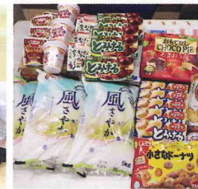
匿名 様 浦添市在住