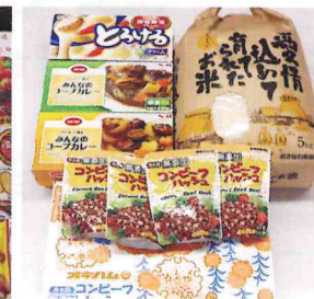
匿名 様 浦添市在住