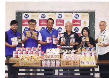
浦添でだこライオンズクラブ 様 浦添市仲間 1-10-7(2F)