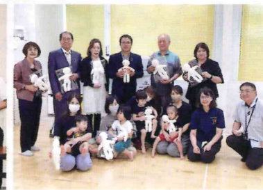
沖縄キワニスクラブ 様 那覇市松尾 1-9-12