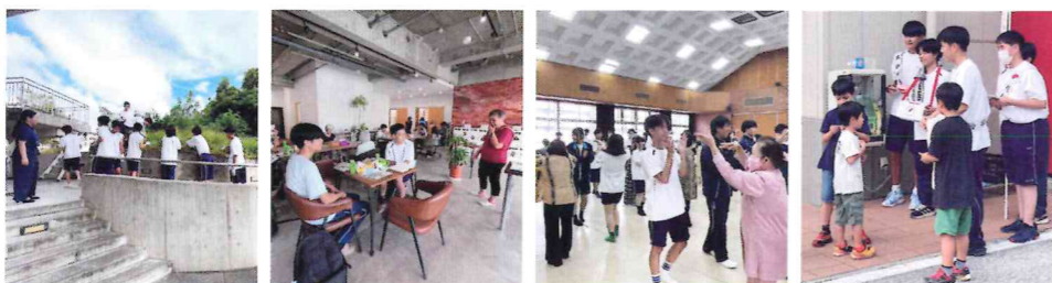
受入先(各自治会/市内児童センター/あじさい公園/障がい者・高齢者施設/福ふくファーム/近隣スーパーなど18カ所)

「地域を知ってつながる」ことを目的に、陽明高校1年生238名が赤い羽根共同募金街頭募金活動や農作業体験、施設でのハロウィン飾り付け準備など、様々な地域探究活動に参加しました。受入して頂いた皆さま、ご協力ありがとうございました。