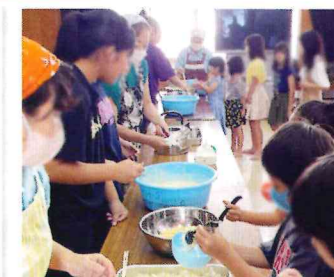
食を通じた子どもたちとの交流「食の応援プログラム」