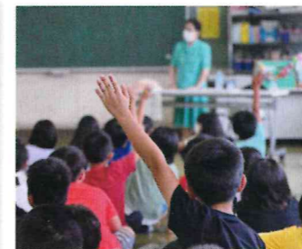
視覚障がい者の当事者講話