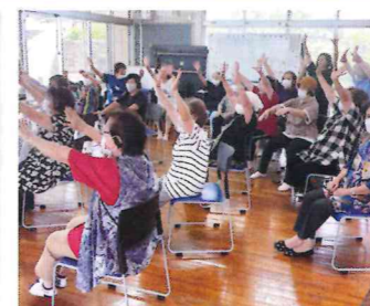
支えあい活動「ふれあいサロン」この日は健康づくり体操!