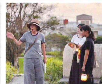
地域を知るボランティア養成