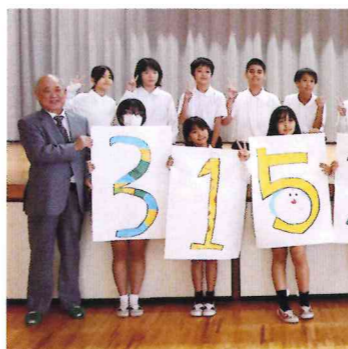
令和6年度 学校募金贈呈式

浦添市内の小・中・高等学校、特別支援学校の児童・生徒の皆さんが主体となり、学校募金活動を実施しています。