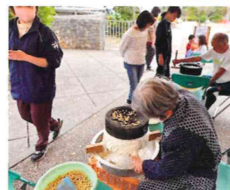
子どもと高齢者の交流を目的としたゆし豆腐づくり